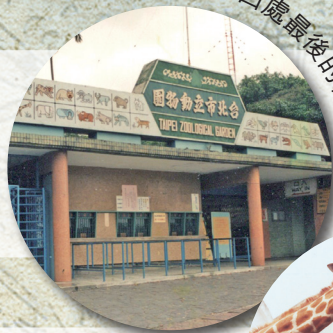
圓山時期入口處最後的樣貌

西元1884年清廷於大稻埕與艋舺兩地之間構築城廓， 「臺北」這一名詞在臺北建城後，成為臺北市的通稱。 今年適逢臺北建城（ ）周年。