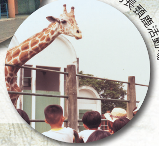
圓山時期的長頸鹿活動場