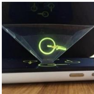
本圖為插圖 非學生教具 勿重製翻印

課中材料：3D 全息投影膜、自製 VR 眼鏡、光線三菱鏡、AR 互動作品、JPSB