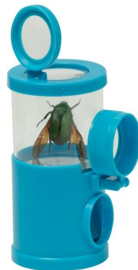
昆蟲放大觀察盒組