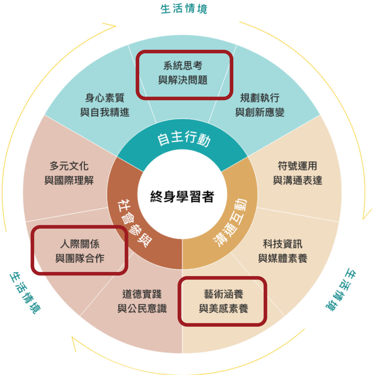
核心素養的內涵（三面九項）