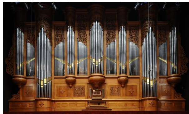
國家音樂廳管風琴