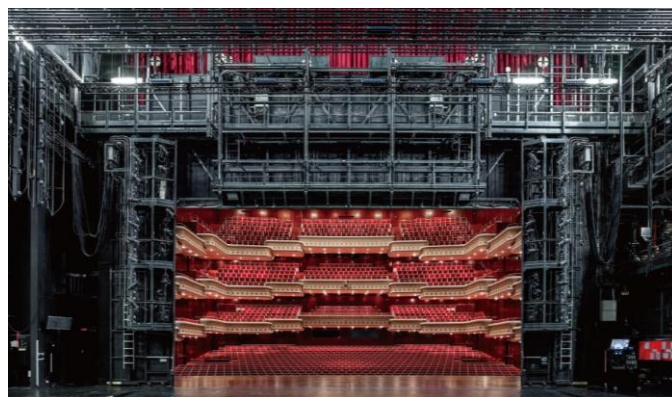
國家戲劇院舞台結構