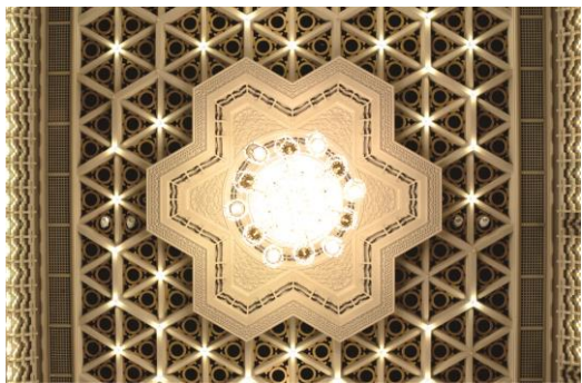
國家音樂廳水晶燈