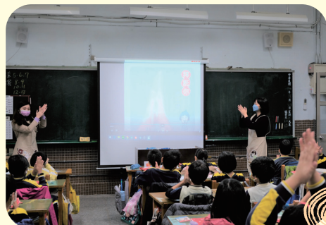
洗手衛教，大家一起把手洗乾淨