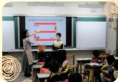
小朋友參與實作練習